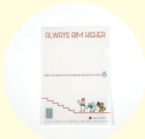
学生がデザインを手がけた オリジナル紙製クリアファイル

千葉大学とは、2015年より環境保全活動に関する情報・意見交換を目的としたディスカッションを皮切りに連携をスタート。今年は、2022年4月の入学式にて配布され、脱プラスチック啓発を目的に学生の皆さんがデザインした、オリジナル紙製ファイルの作成に協力しました。また、FSC®認証制度について知識を深めたいとご相談をいただき、三菱製紙エコシステムアカデミー協力のもと、環境学習の機会を設ける等、様々な連携を進めています。